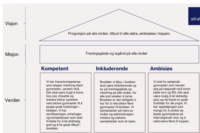
Klubbens nye strategihus